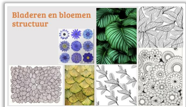
Helemaal boven lijn structuur & hier bloem structuur

Ga opzoek naar texturen, die VOELBAAR zijn. Denk aan een legobouwplaat of nopjesplastic. Zoek 4 van deze voelbare texturen. Pak vier verschillende kleurpotloden. Leg een wit leeg vel over de structuur en ga er heel voorzichtig overheen zodat de vormen zichtbaar worden.