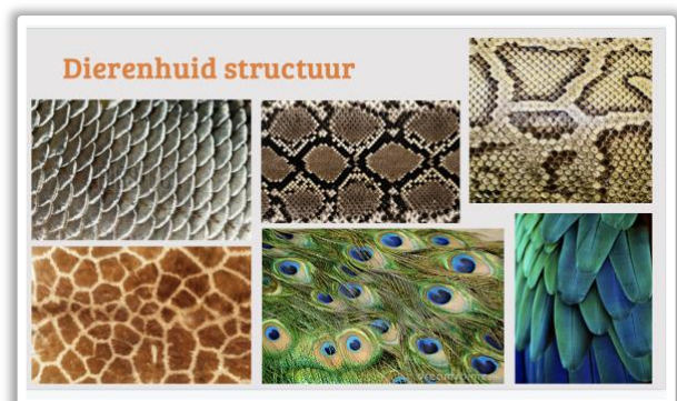
Dierenhuid / vacht / veer structuren